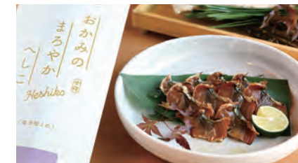
日本酒「女将」の酒粕を使って約2週間漬け込むことで、塩分が半分ほど抑えられてまろやかなる。1,300円。

みのまるやかへしこ」の原材料に使うことでSDGsの取り組みにも。スライスしてそのままや、炙ってもおいしいが、発酵チームの女将たちのおすすりはパスタに具材として合わせることに。「味が濃い」というへしこのイメージを変えると同時に、「おかみのまる