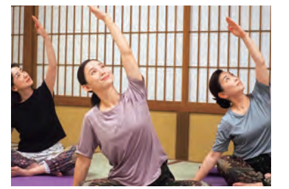
毎月各旅館が持ち回りで開催。温泉の入り方などオリジナルのアドバイス付きドジャ(体験)チェックシートも。参加費1人1,000円。

だけでなく、地元の人も参加できる。「これまで朝ヨガを行ってききましたが、今年は夜ヨガも開催。多彩なニーズに対応し、皆さんが心身ともに健康になれる温泉地を目指したいです」。