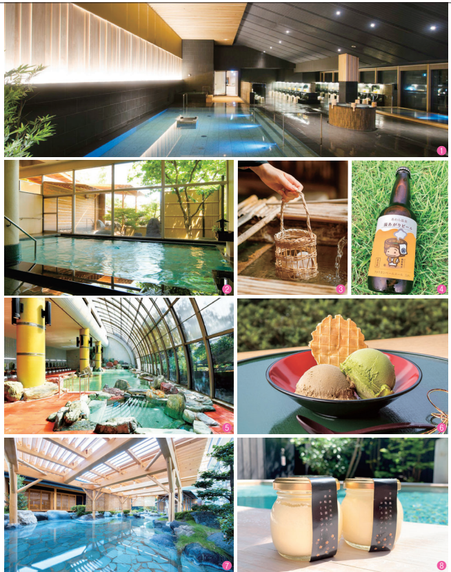
①グランディア芳泉 ②長谷川 ③つるやの温泉玉子 ④あわら温泉湯あがりビール ⑤美松 ⑥美松のスイーツ ⑦清風荘 ⑧清風荘のスイーツ