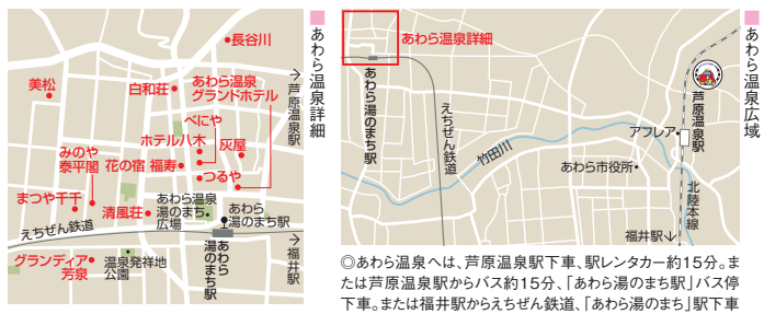
◎あわら温泉へは、芦原温泉駅下車、駅レンタカー約15分。または芦原温泉駅からバス約15分、「あわら湯のまち駅」バス停下車。または福井駅からえちぜん鉄道、「あわら湯のまち」駅下車