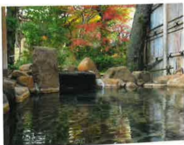
さきの湯温泉 竹葉

JR山陰本線安来駅から足立美術館無料シャトルバスで20分。チェックイン16～19時、チェックアウト10時。島根県安来市古川町438 ☎0854・28・6231