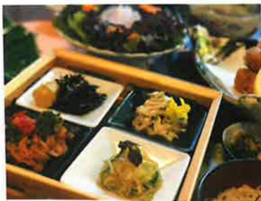
いち押しメニュー マクロビオティック料理

JR山陰本線安来駅から足立美術館無料シャトルバスで20分。チェックイン16～19時、チェックアウト10時。島根県安来市古川町438 ☎0854・28・6231