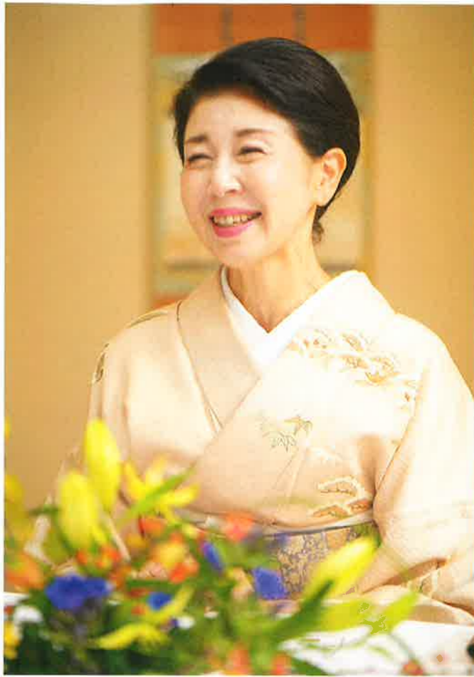
「唎酒師女将だからできたこと」