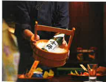
いち押しメニュー 純米吟醸 女将

えちぜん鉄道三国芦原線あわら湯のまち駅から徒歩7分、またはJR北陸本線芦原温泉駅からシャトルバスまたはタクシーで10分。チェックイン15～18時、チェックアウト10時。福井県あわら市舟津43-26 ☎0776・77・2555