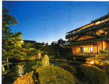
あわら温泉 グランディア芳泉

えちぜん鉄道三国芦原線あわら湯のまち駅から徒歩7分、またはJR北陸本線芦原温泉駅からシャトルバスまたはタクシーで10分。チェックイン15～18時、チェックアウト10時。福井県あわら市舟津43-26 ☎0776・77・2555